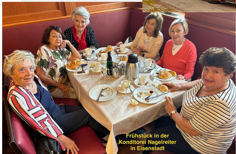
Frühstück in der Konditorei Nagelreiter in Eisenstadt