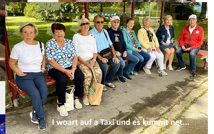
I woart auf a Taxi und es kummt net...